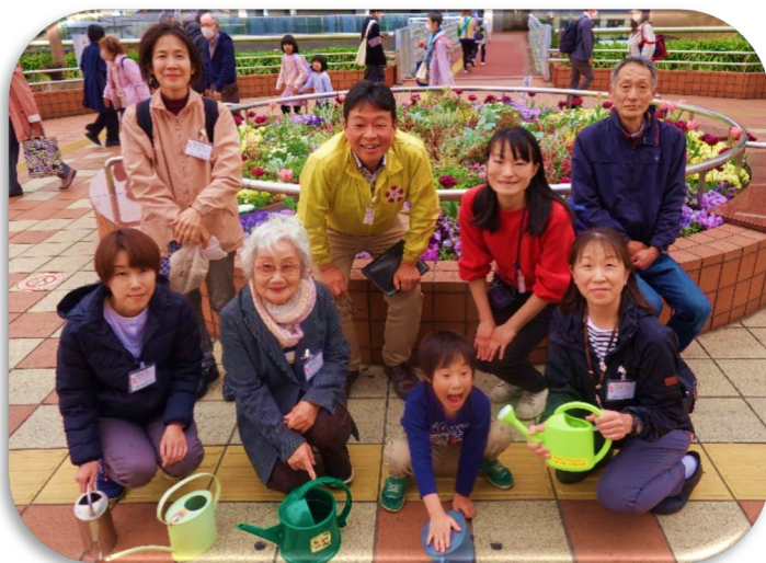
ハマロード・サポーター活動で集まった「花まちプロジェクト」のみなさん

「花まちプロジェクト」のキャッチコピーは、“神奈川県魅力再発見、花とみどりでつながるまちづくり”です。公園同士、花好きな人同士がつながり、花と緑をきっかけに人の交流を目指しています。