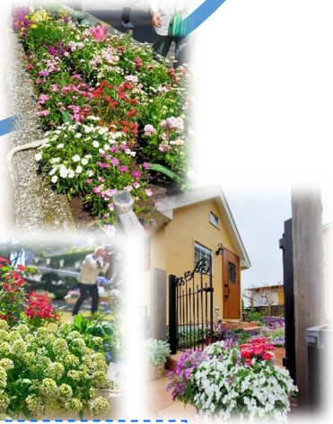
おすすめ花スポット抜粋