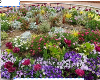
東神奈川駅前の花壇

2023年8月 ハマロード・サポーターとして活動開始 地域の有志も仲間に加わり、東神奈川駅連絡橋の花壇の手入れを始める